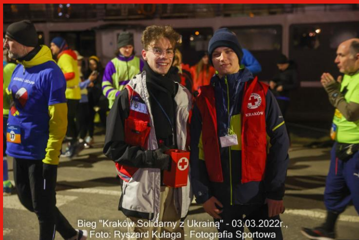
Bieg "Kraków Solidarni z Ukrainą" - 03.03.2022r.

Na zaproszenie Stowarzyszenia ITMBW kwesta podczas biegu „Solidarni z Ukrainą”.