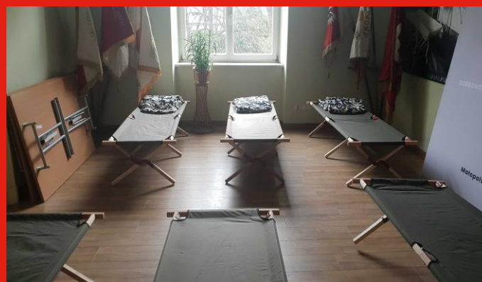
Miejsca tymczasowego pobytu

Łącznie w 2022 MOO PCK pozyskał darowizny pieniężne od osób fizycznych i prawnych w kwocie 3 876 921,11 zł , a z tytułu darowizn rzeczowych od osób fizycznych i prawnych w wysokości 7 864 365,50 zł