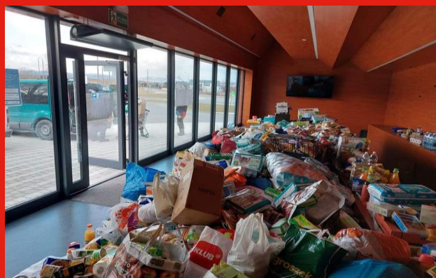
Zbiórka finansowa i zbiórka darów

Łącznie w 2022 MOO PCK pozyskał darowizny pieniężne od osób fizycznych i prawnych w kwocie 3 876 921,11 zł , a z tytułu darowizn rzeczowych od osób fizycznych i prawnych w wysokości 7 864 365,50 zł